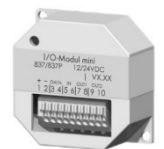
I/O module mini