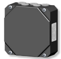
I/O module plus